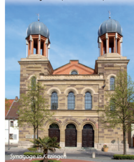
Synagoge in Kitzingen

Daarbij dient echter te worden bedacht dat er onder de Joodse synagogen vele waren waar de wet en de profeten gelezen en in ere gehouden werden. Zulke synagogen waren zowel voor de Heere Jezus (Matth. 4:23; Luk. 4:16